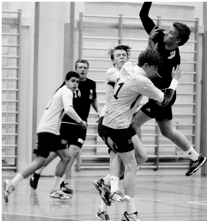
NESTEN KONTROLL: SIL hadde stort sett kontroll på Steinkjer 2, men seieren glapp i sluttsekundene.

Steinkjer starter fra midten, spiller kjapt fram til venstrevingen, overrumpler SIL, og rekker akkurat å skyte i mål til