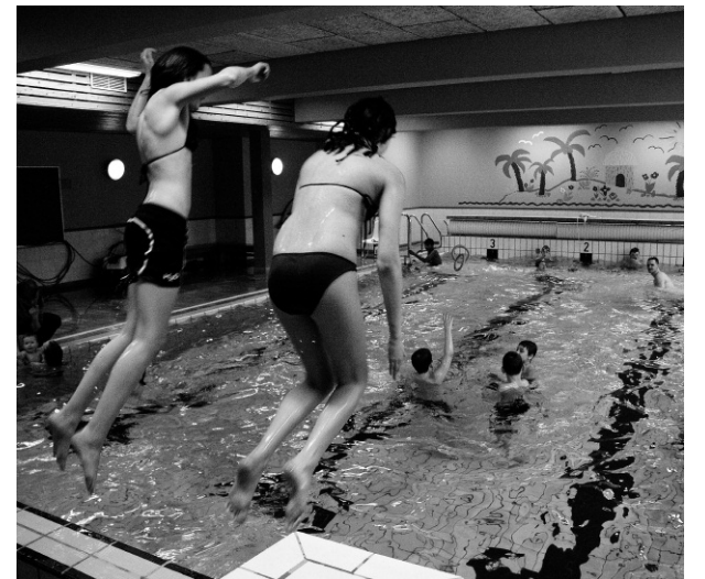
REPARERES: Bassenget på Tomma blir dyrere enn først antatt å reparere. Nå vil administrasjonen øke kostnadsramma fra 90.000 til 200.000 kroner.

■ Formannskapet får saken til behandling 11. oktober.