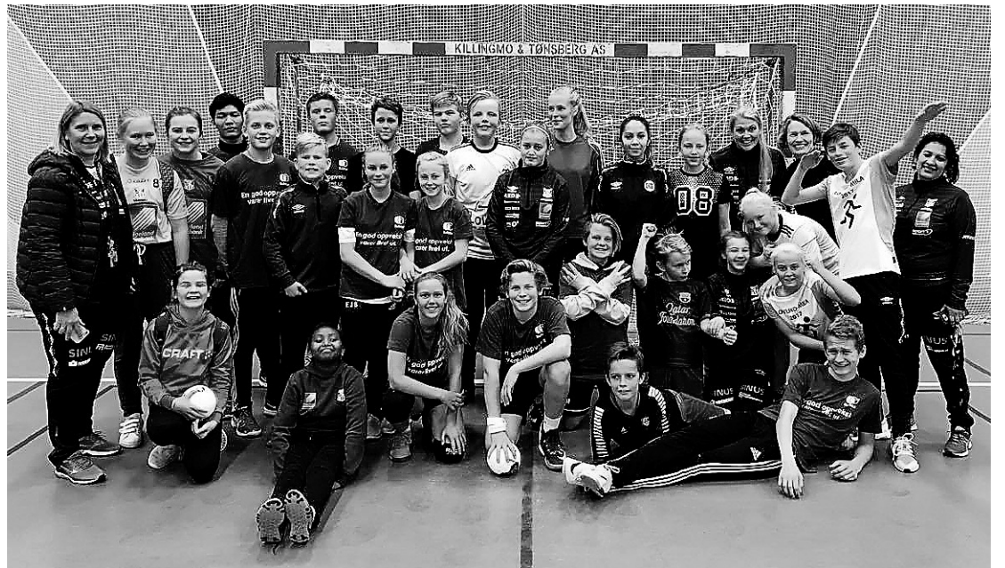
HÅNDBALL: Unge håndballspillere fra SIL og Lovund.

Det er stor stemning på banene. SIL-trenere har invitert inn spillere i forskjellige aldersklasser, slik at det er mulig å sette sammen lag med spillere på omtrent samme alder og nivå. Så spiller de ulike la-